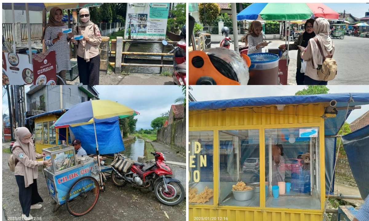
Gambar 1. Kegiatan sosialisasi STARLA kepada pedagang dan pembeli.